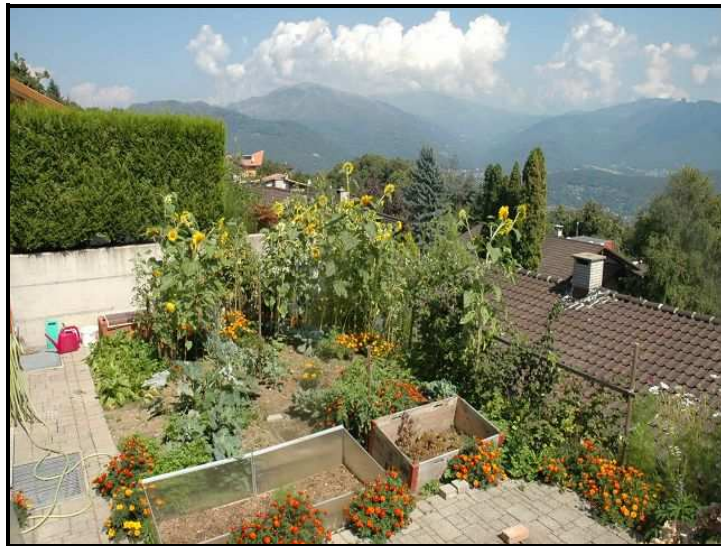
Orto / Gemüsegarten