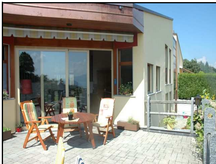
Terrazza e casa / Terrasse mit Haus