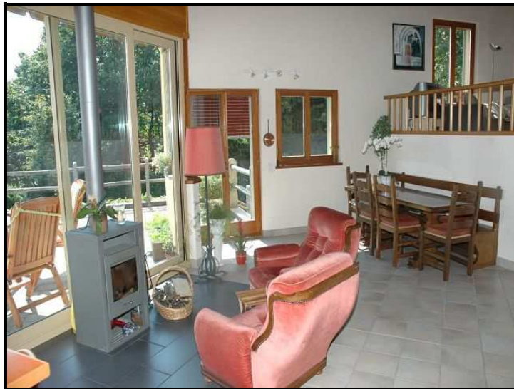
Soggiorno e pranzo sotto / Wohn-/Essbereich unten