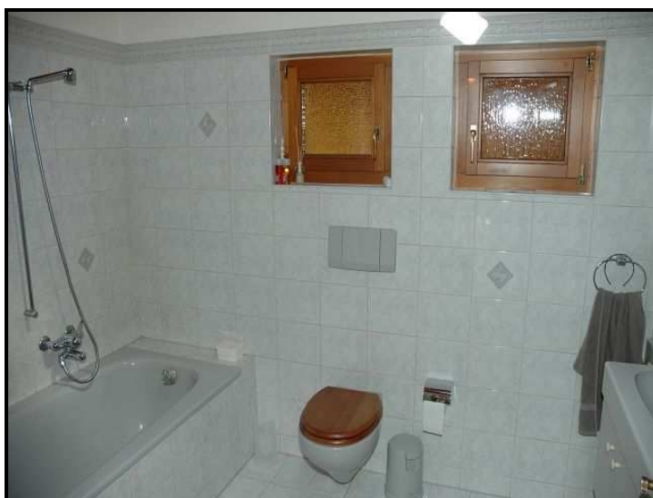
Bagno / Bad