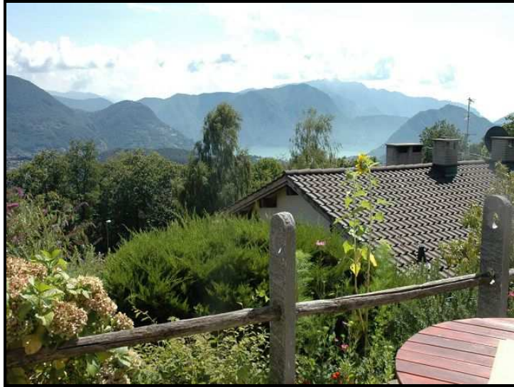
Vista sul Lago di Lugano / Blick auf Luganersee