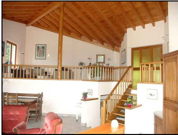
Soggiorno / Wohnraum