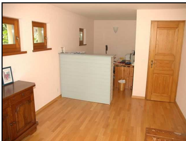
Ufficio / Büro