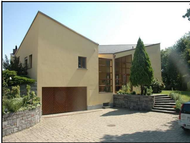
Facciata nord con entrata / Nordfassade mit Zufahrt