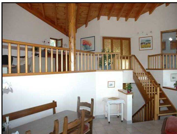
Pranzo e galleria / Essbereich mit Galerie