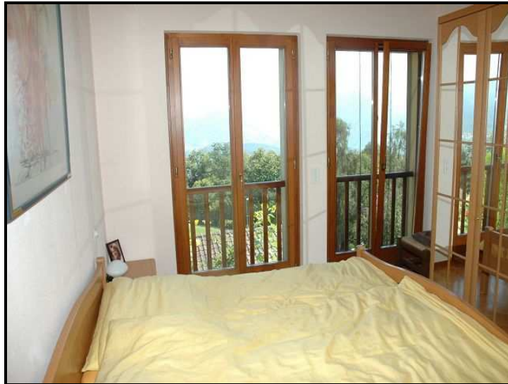
Camera / Schlafzimmer