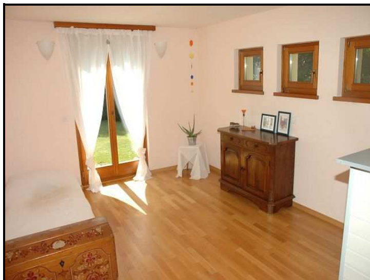
Ufficio / Büro