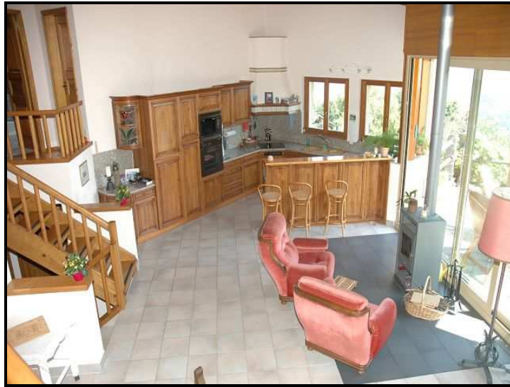
Vista sul soggiorno e cucina / Blick auf Wohnbereich und Küche