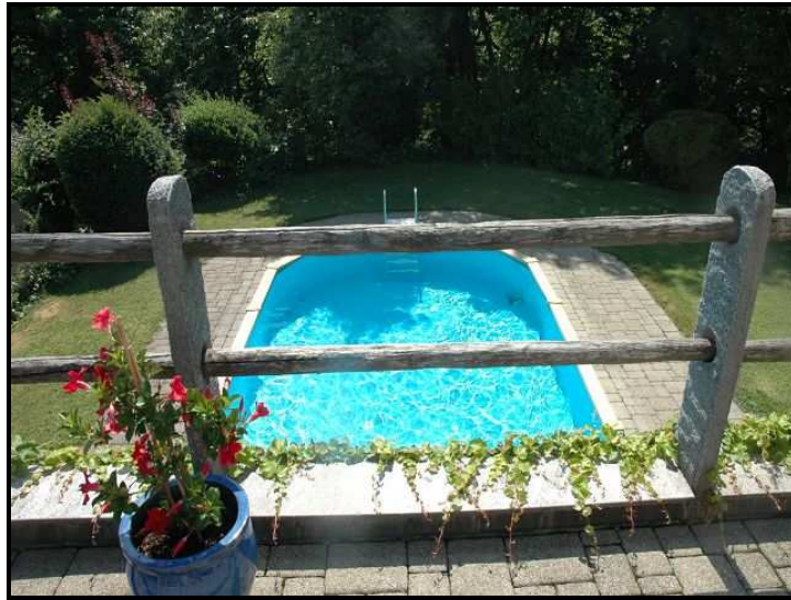
Piscina / Schwimmbad