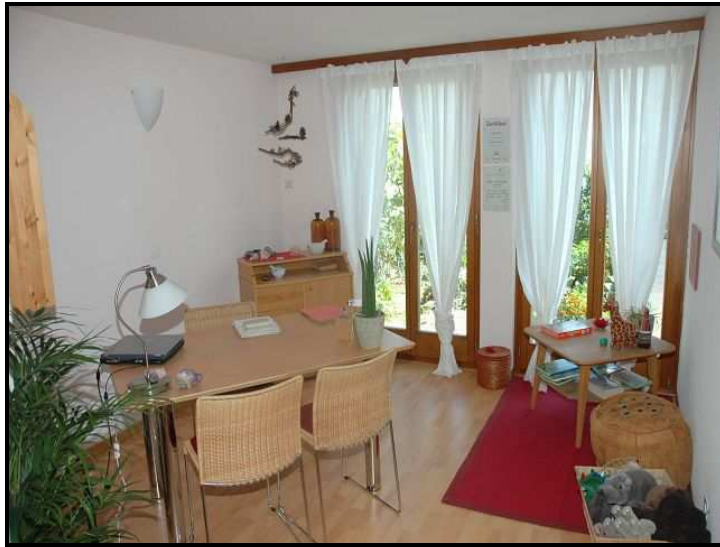
Camera / Zimmer