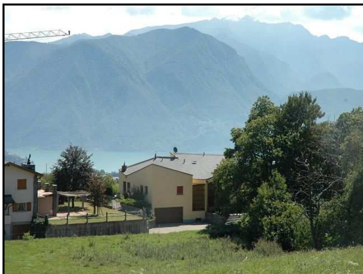
Vista sulla proprietà / Blick auf die Liegenschaft