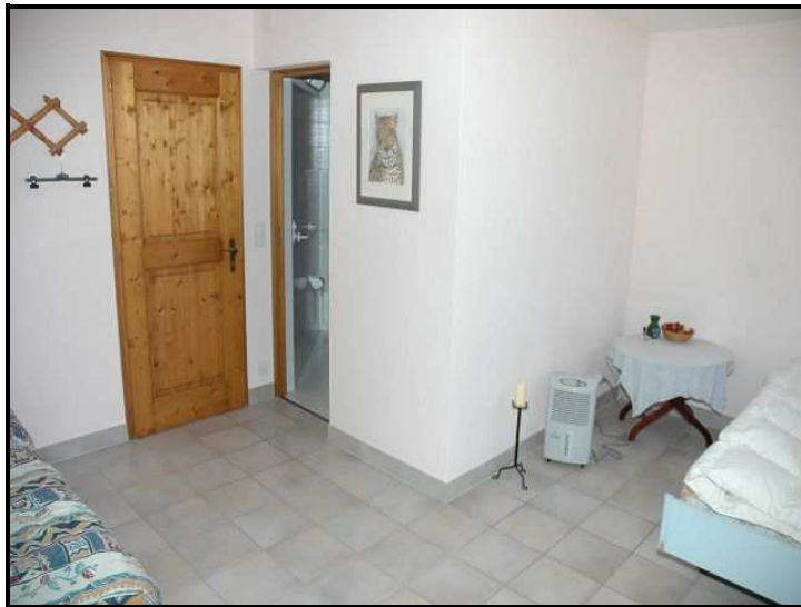
Camera sotto / Zimmer unten