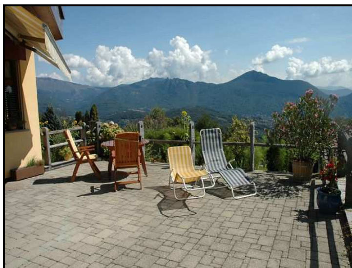
Terrazza con vista sud-est / Terrasse mit Südostblick