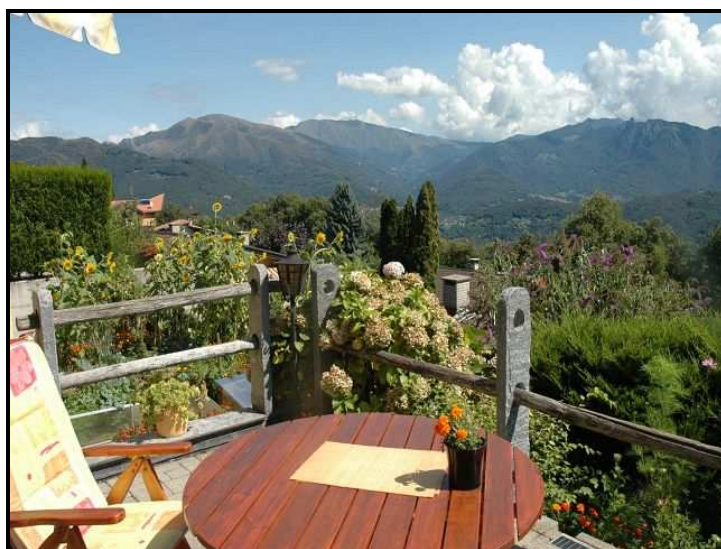
Vista verso nord-est / Blick nach Nordosten