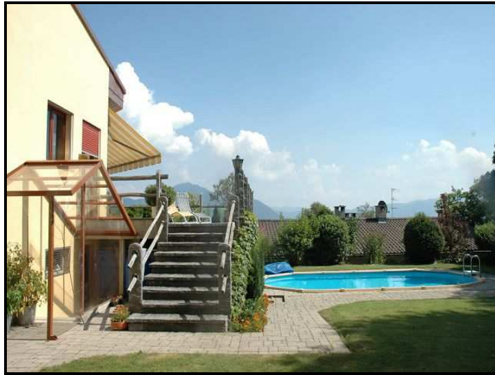
Piscina e terrazza / Schwimmbad mit Terrasse