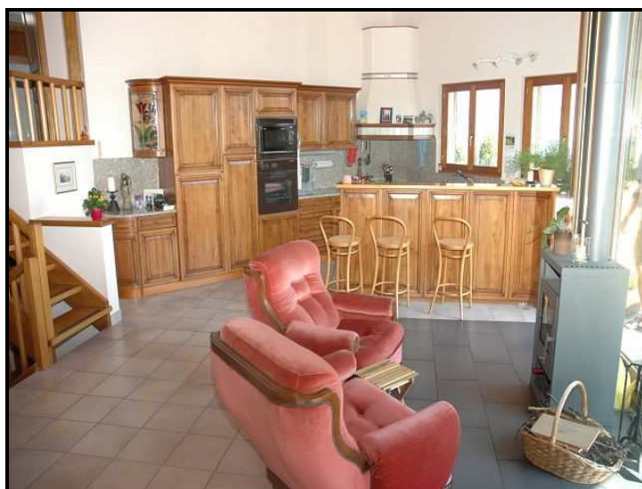
Soggiorno e cucina / Wohnbereich mit Küche