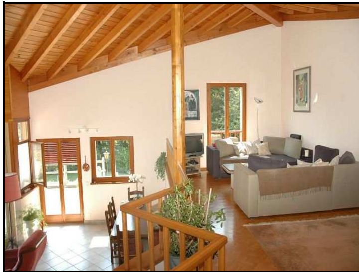
Zona soggiorno sopra / obere Wohnzone