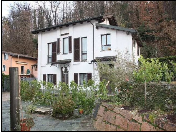
Casa degli ospiti / Gästehaus