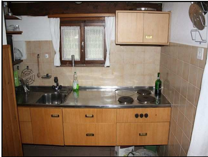
Cucina / Küche