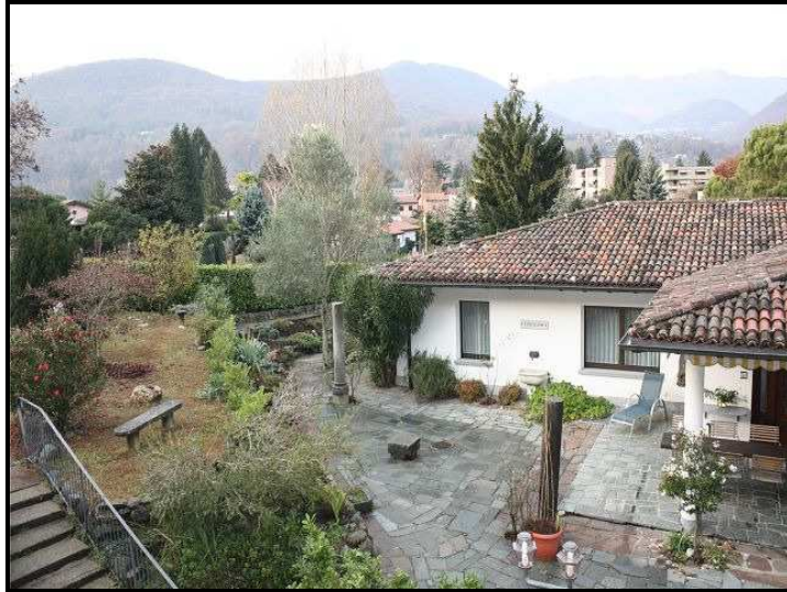
Vista verso ovest / Westblick