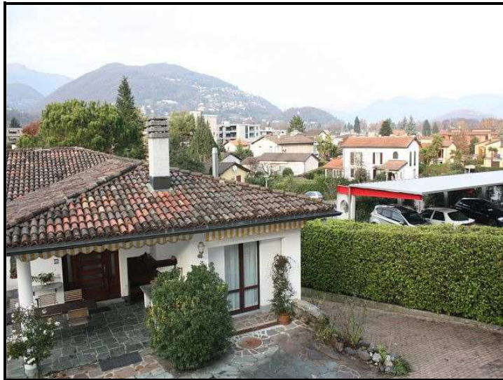
Vista verso nord / Nordblick