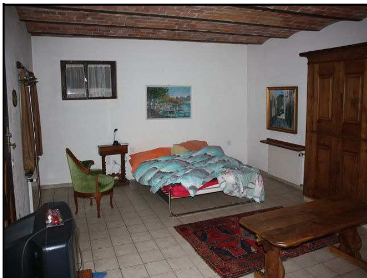
Camera nel piano terra / Erdgeschossraum