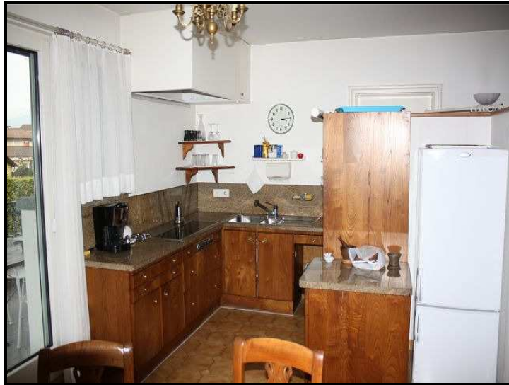
Cucina / Küche