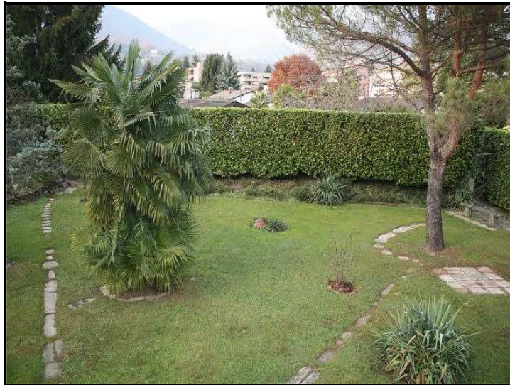
Vista sul giardino / Blick auf Garten