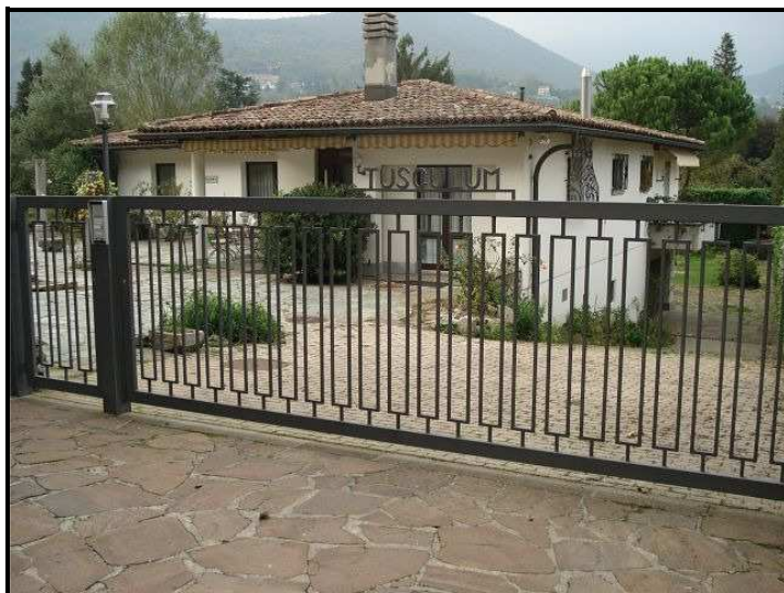
Entrata / Einfahrt