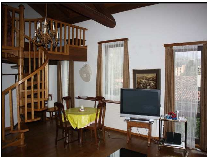
Soggiorno sopra / Wohnraum oben