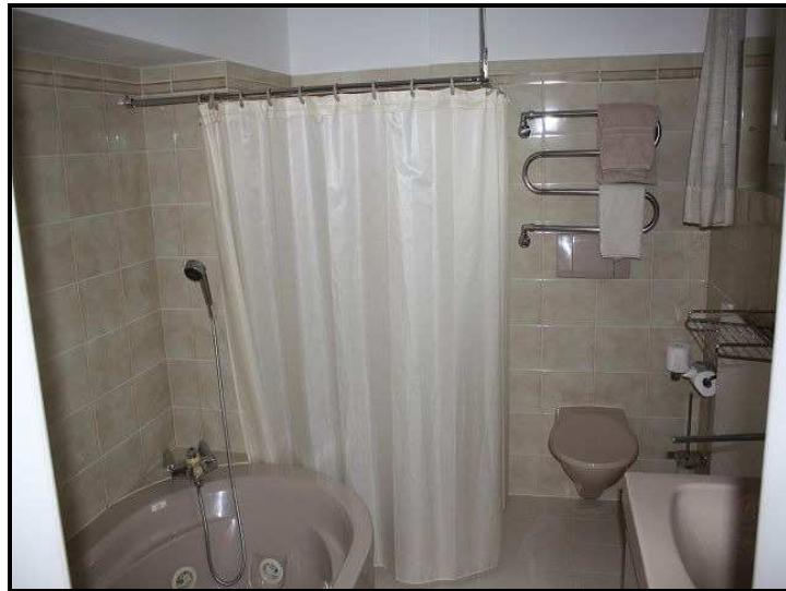
Bagno / Bad