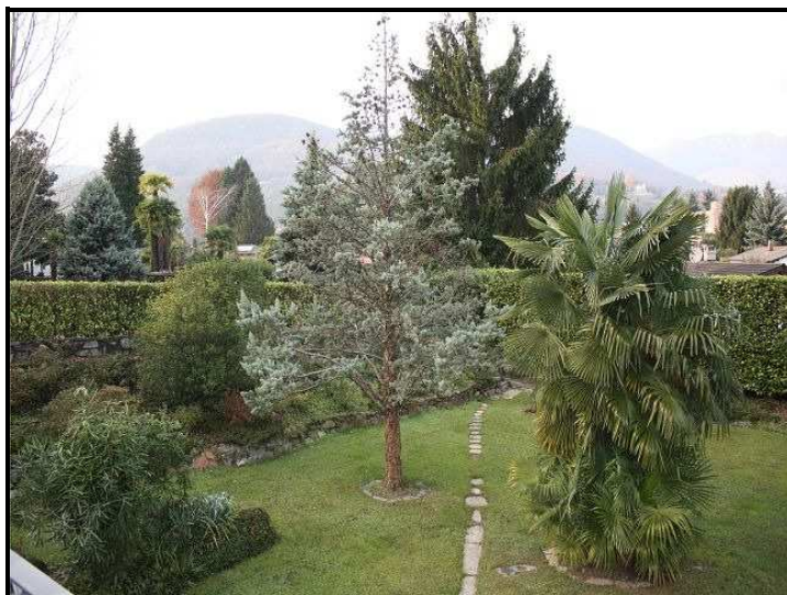
Vista sul giardino / Blick auf Garten