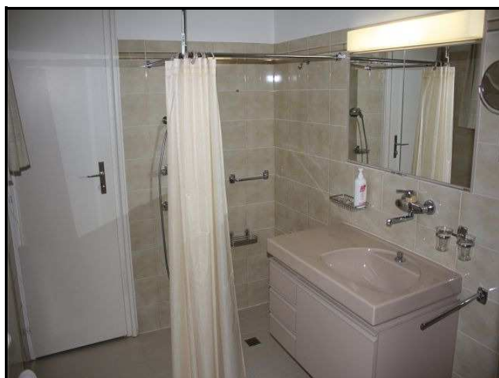
Doccia / Dusche