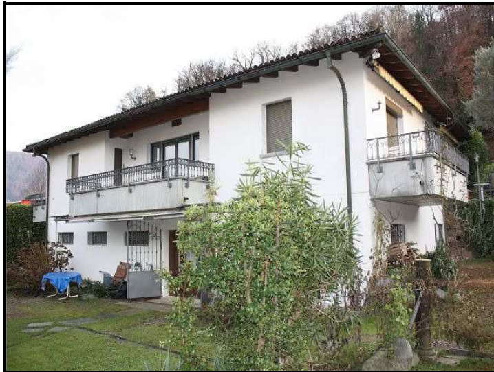
Facciata ovest / Westfassade