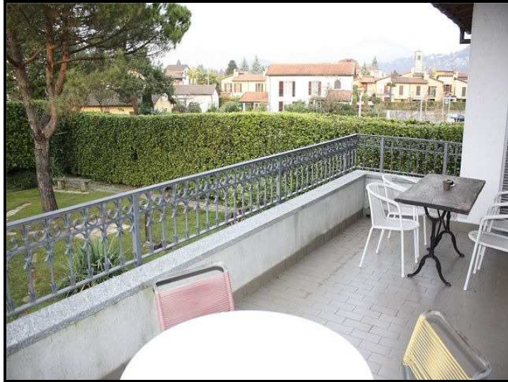
Terrazza / Terrasse