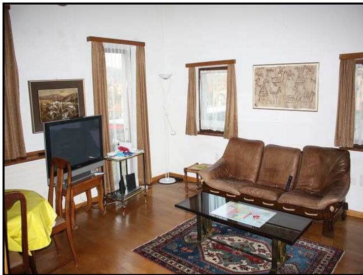
Soggiorno sopra / Wohnraum oben