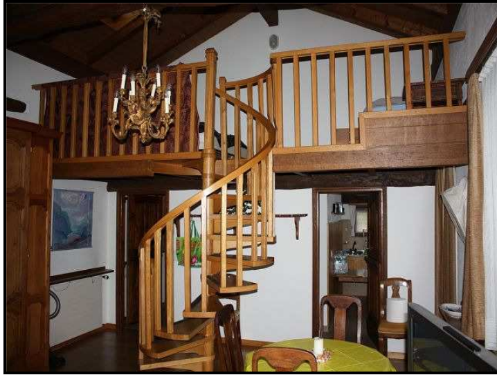
Galleria / Galerie