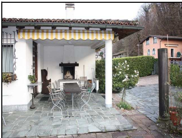
Cortile / gedeckter Sitzplatz