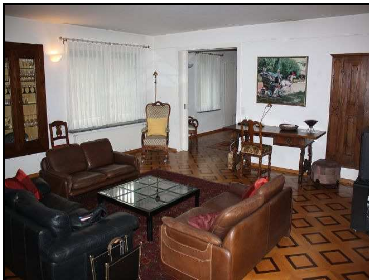
Soggiorno / Wohnraum