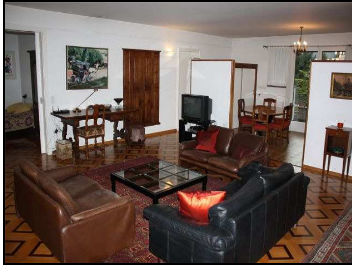
Soggiorno / Wohnraum