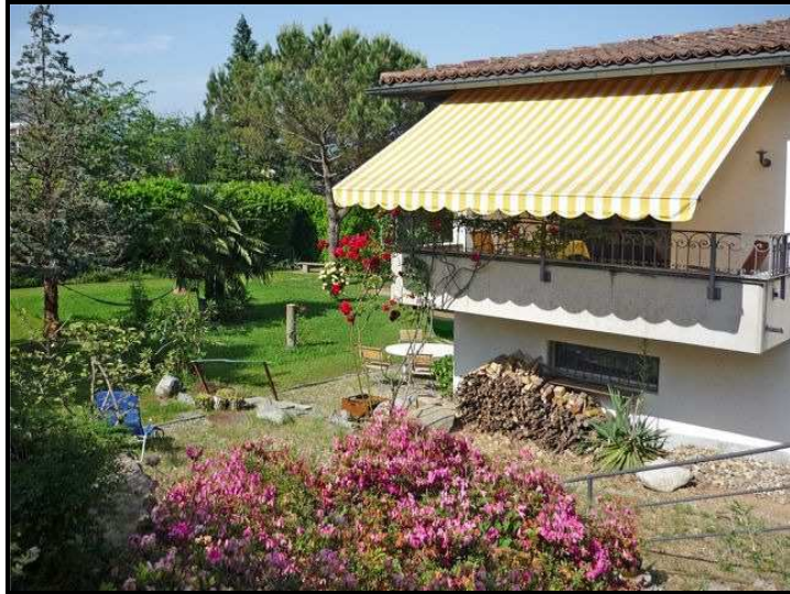
Casa e giardino / Haus mit Garten