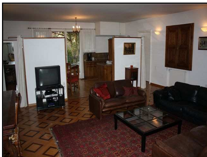
Soggiorno / Wohnraum