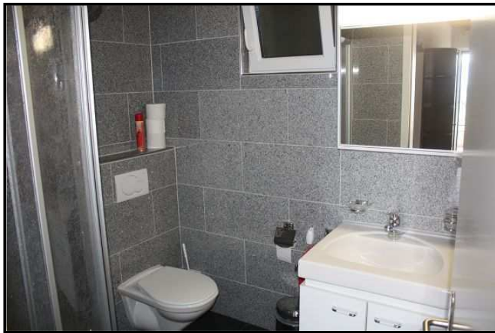
Doccia / Dusche in Einliegerwohnung