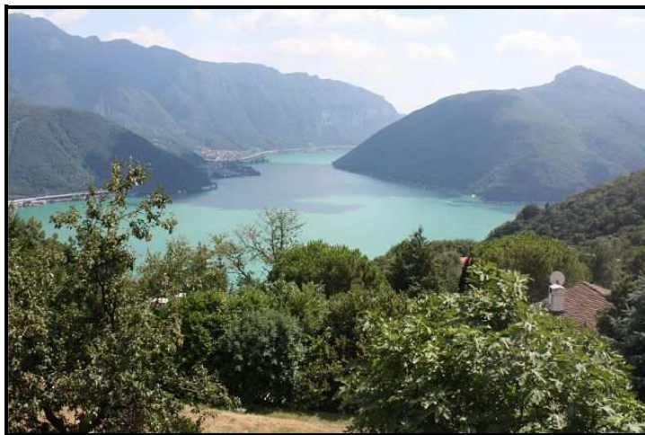
Vista sud / Südblick