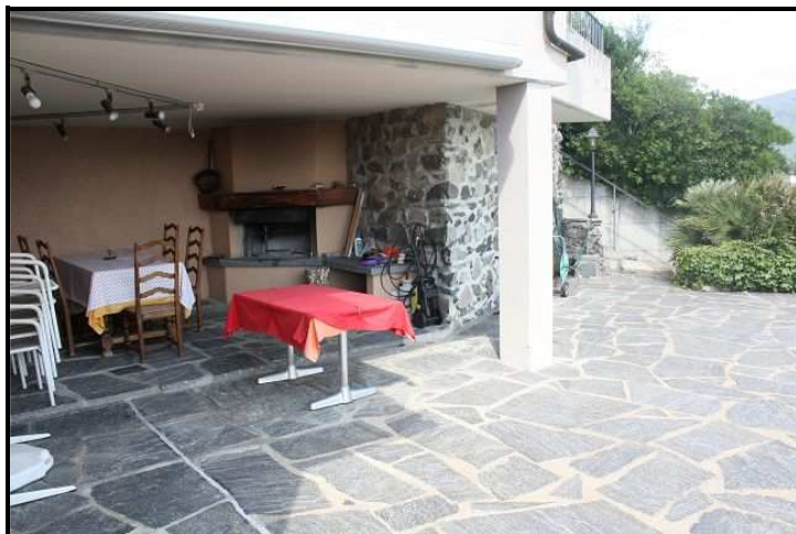
Terrazza con portico