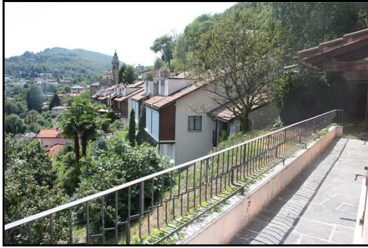
Balcone e vista verso Carona / Balkon mit Blick auf Carona