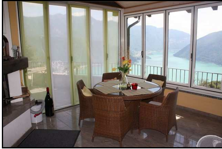
Giardino d'inverno / Wintergarten