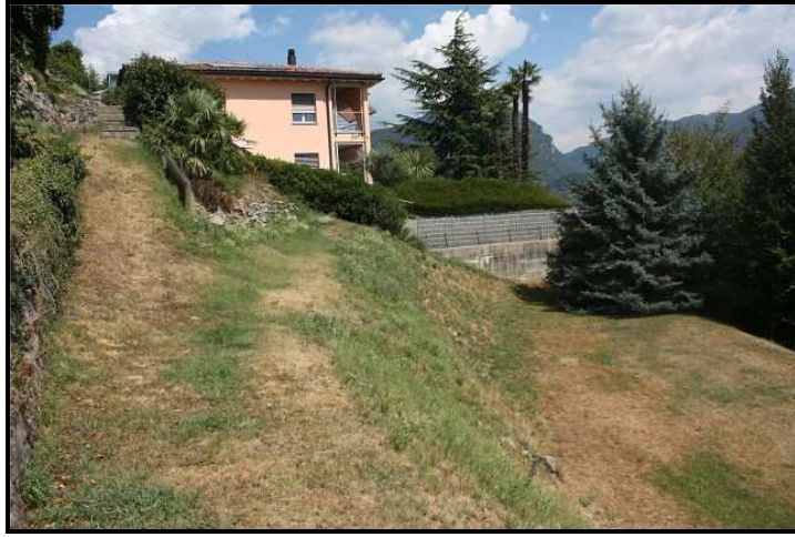
Terreno / Bauland