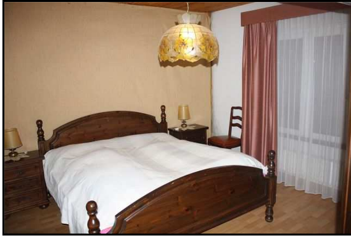
Camera / Zimmer in Einliegerwohnung