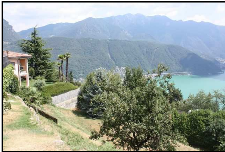
Vista verso est / Ostblick