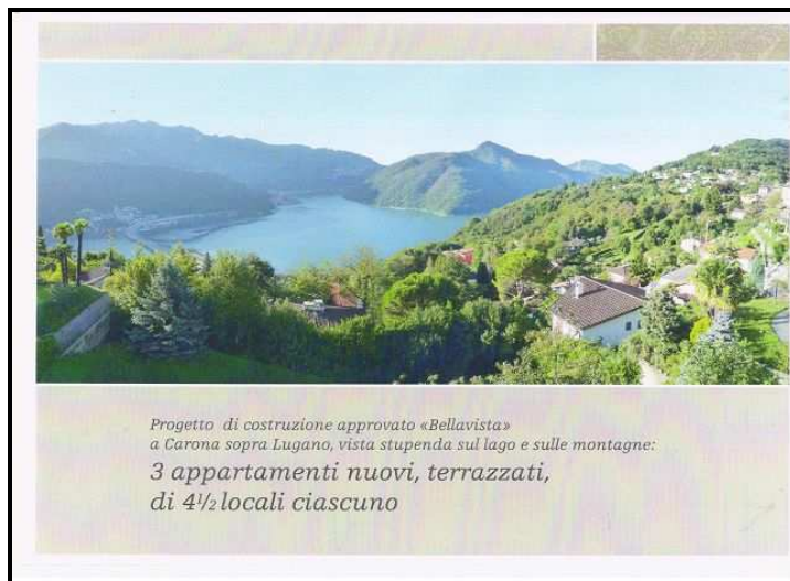
Progetto / Projekt