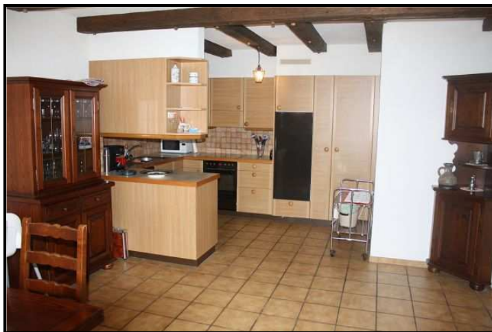
Cucina sotto / Küche in Einliegerwohnung