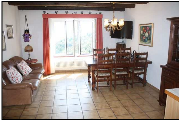
Soggiorno / pranzo sotto / Wohn-/Essraum Einliegerwohnung